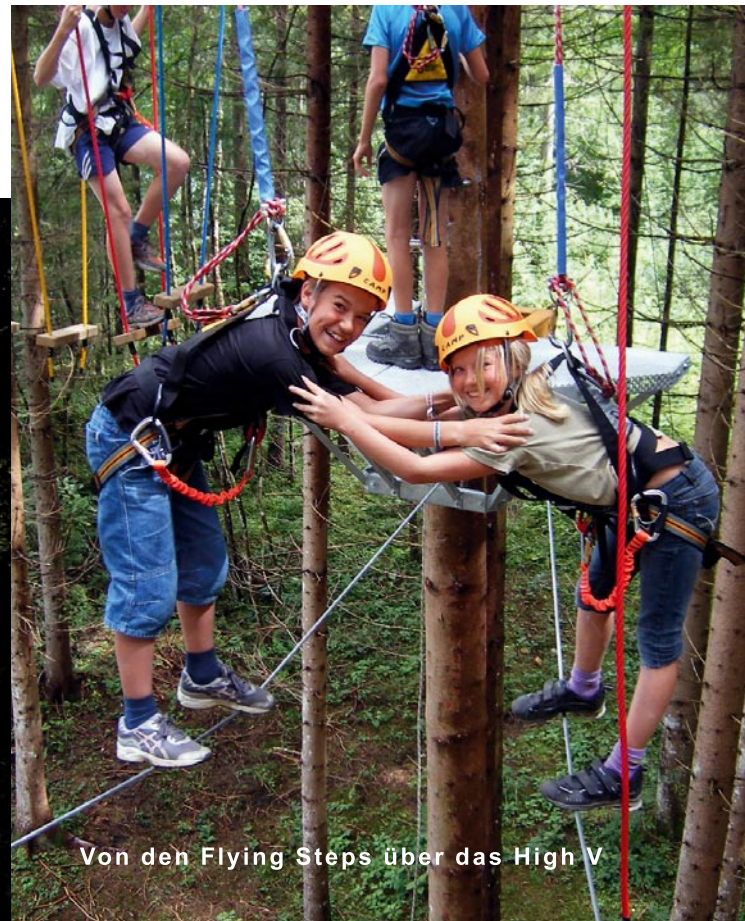
Von den Flying Steps über das High V

Der Kinderparcours wird über einen eigenen Leiteraufstieg erreicht. Ideal für ganze Schulklassen!