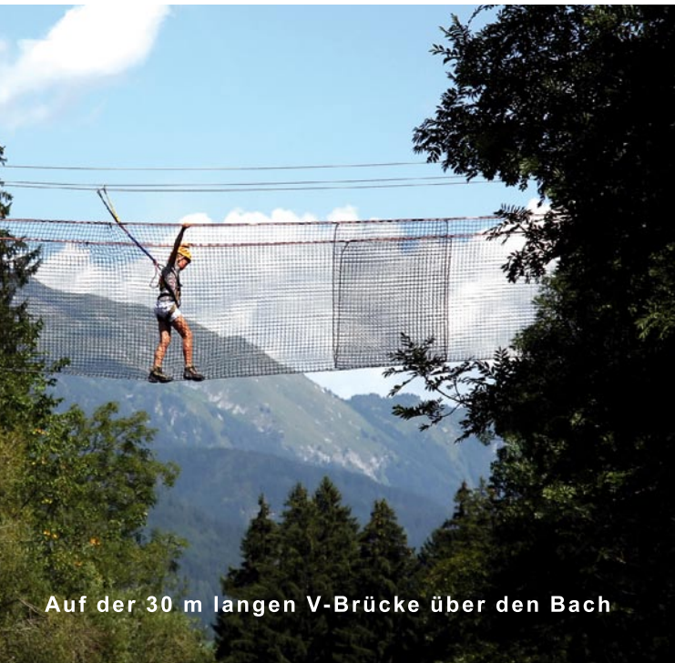
Auf der 30 m langen V-Brücke über den Bach

Der Parcours wird über einen eigenen Ausgang erreicht, führt über den Bach in den Wald und retour. Die Ausführung der Übungen wird nach ACCT-Standards (Association for Challenge Course Technology) durchgeführt.