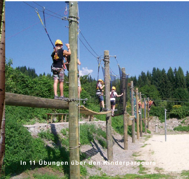
In 11 Übungen über den Kinderparcours

Der Hochseilgartenbetrieb findet ausschließlich unter Aufsicht unserer geprüften HG-Führer statt.